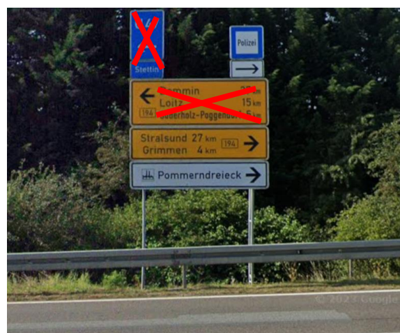
Anlage A 31