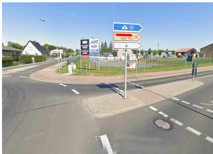
Anlage A 33