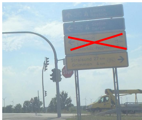
Anlage A 30