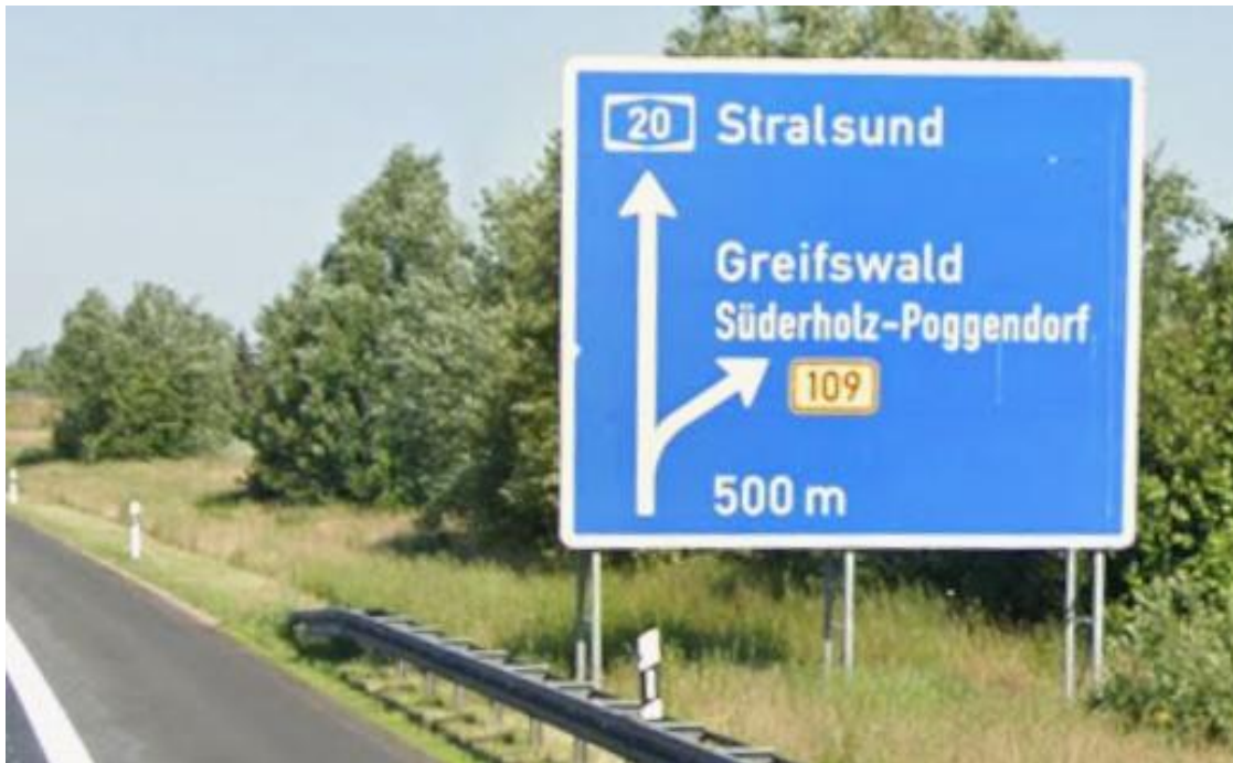
A20 zur AS Greifswald RiFA Lübeck aus südlicher Richtung