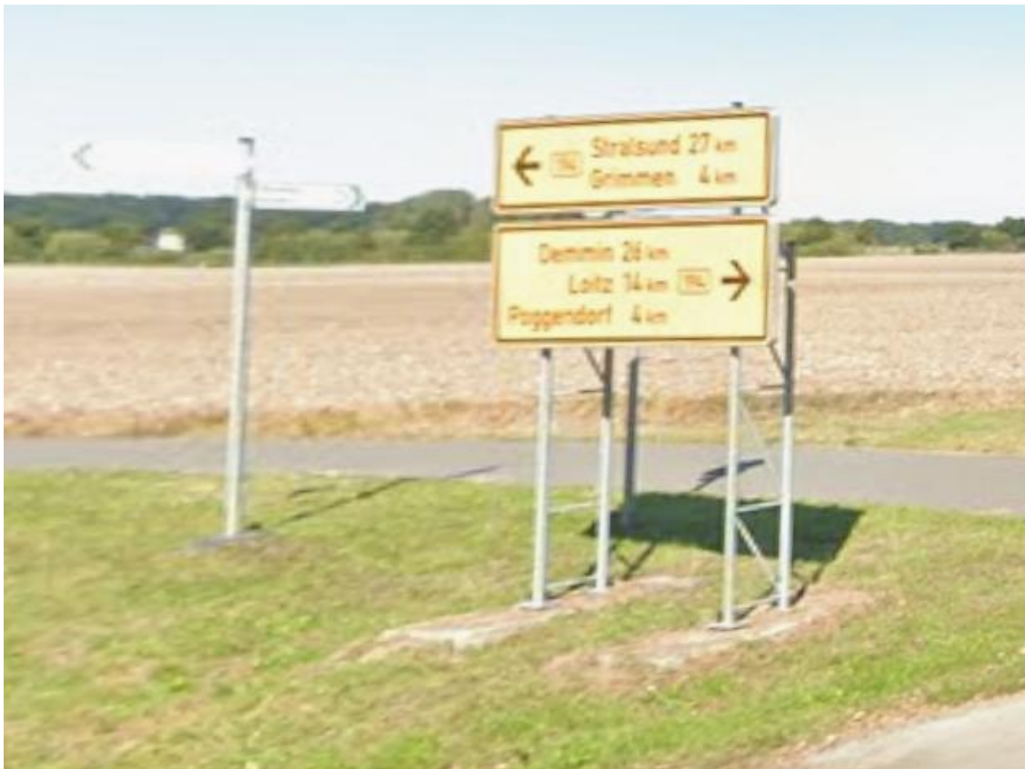
Einmündung An der Dorfstraße zur B 194 von Klevenow