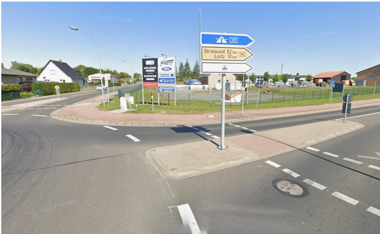
Ausfahrt vom Kreisverkehr zur B194 nördlich der Trebel in Demmin