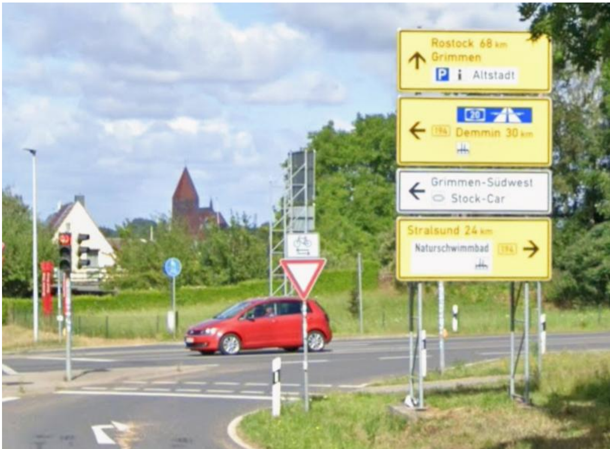
Kreuzung B 194 / Kaschower Damm (L 30), Abzweig Richtung Norden