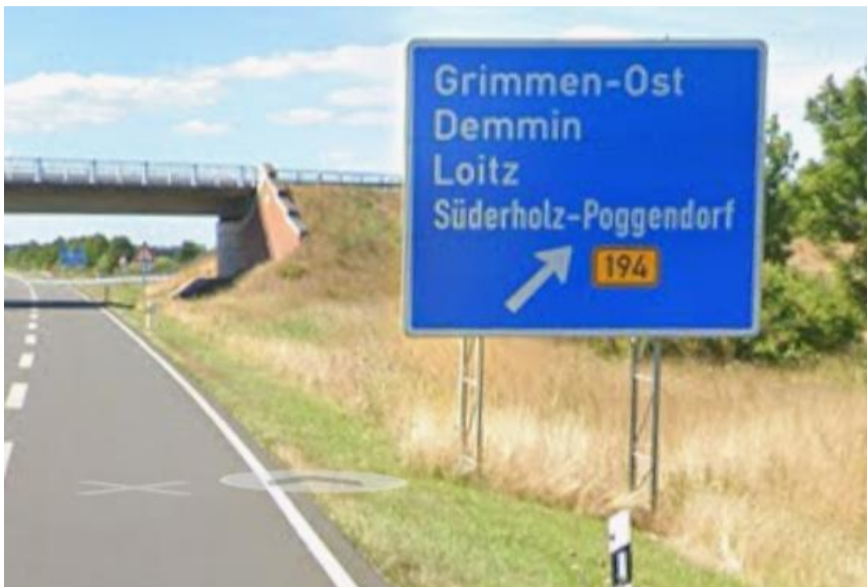
A20 AS Grimmen-Ost Ausfahrt aus östlicher Richtung