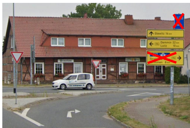
Anlage A 6