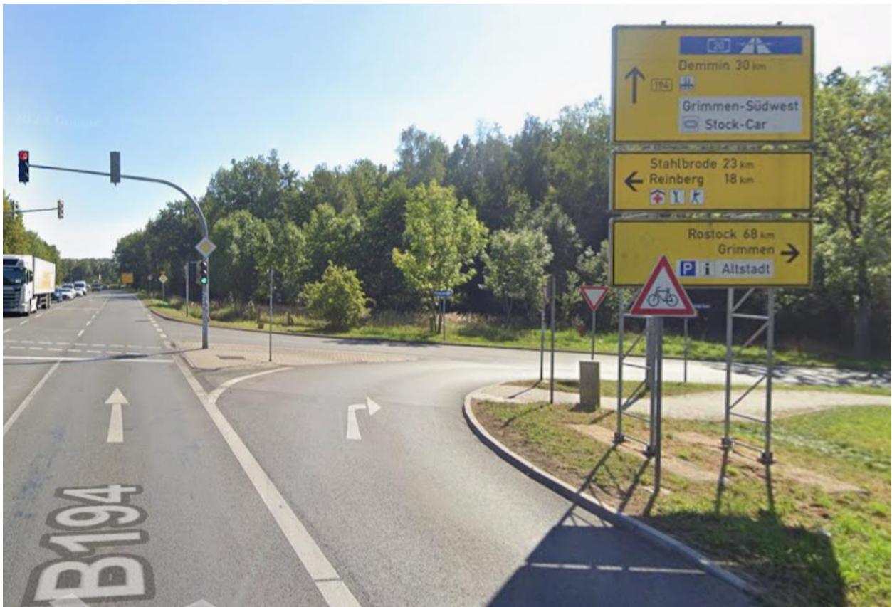
Kreuzung B 194 / Kaschower Damm (L 30), Abzweig nach Grimmen