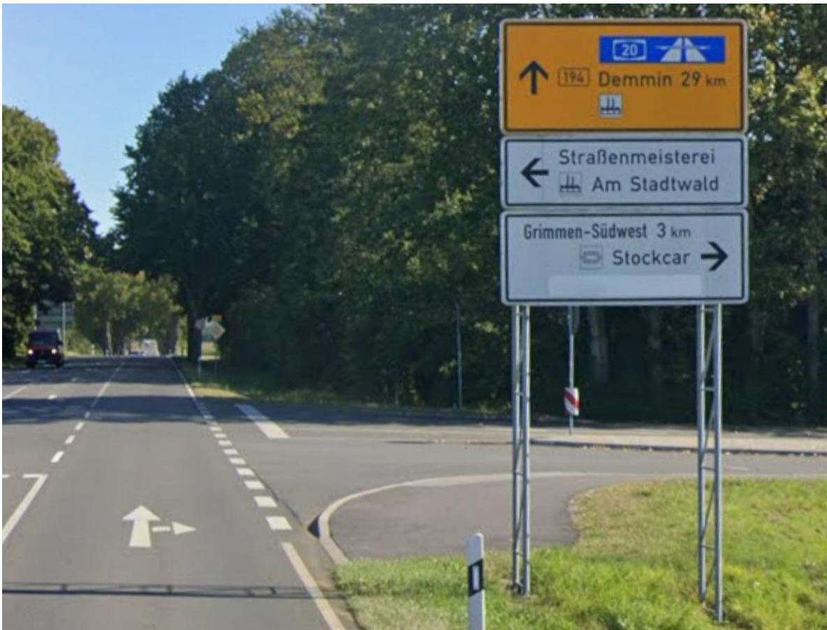
Kreuzung B 194 / Südliche Randstraße / Zum Rauhen Berg