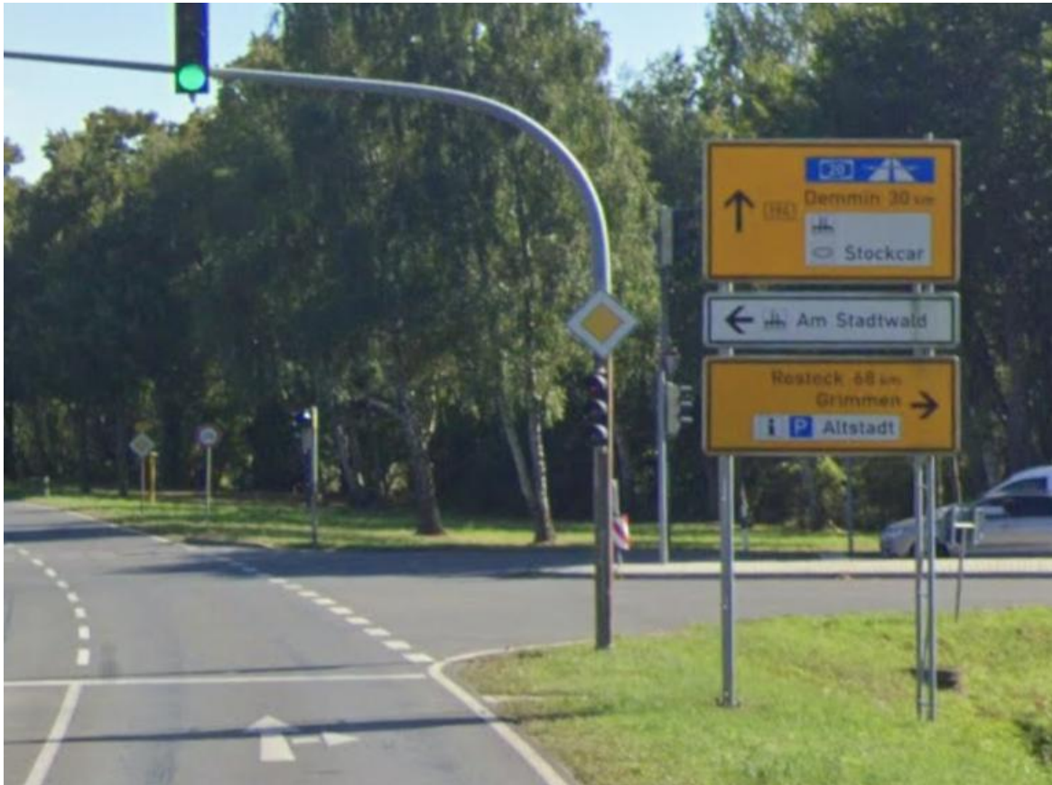
Kreuzung B 194 / Greifswalder Ch. / Zum Rauhen Berg, Abzweig Grimmen