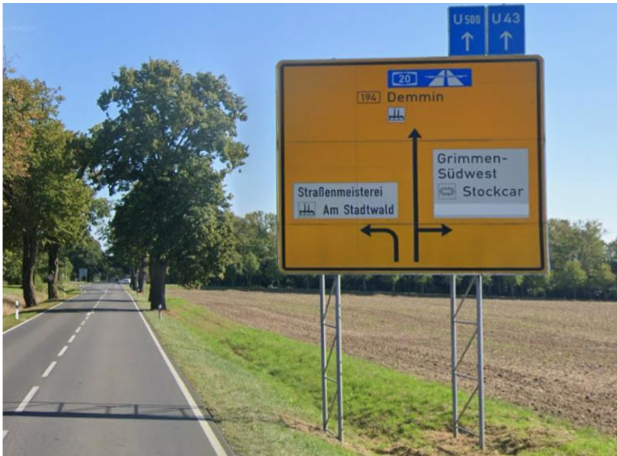
B 194, in Richtung Kreuzung B 194 / Südliche Randstraße / Zum Rauhen Berg