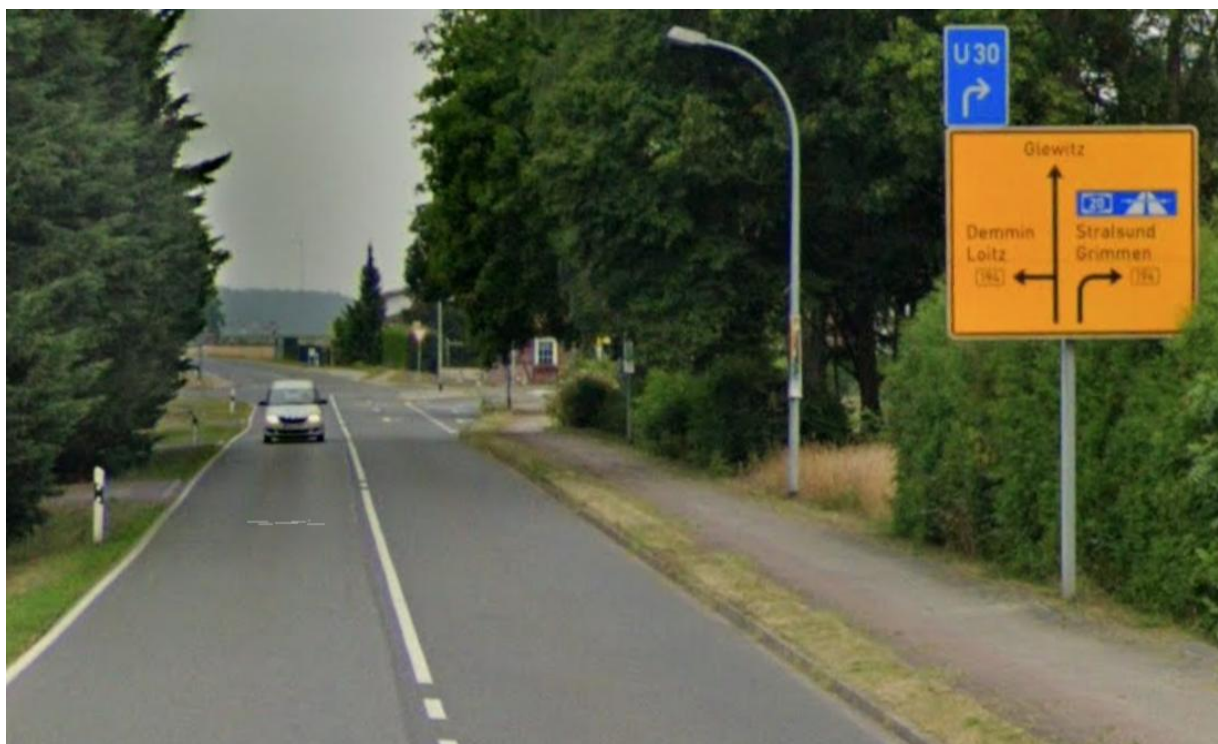
L 26 aus Richtung Kandelin kommend in Richtung Kreuzung Poggendorf