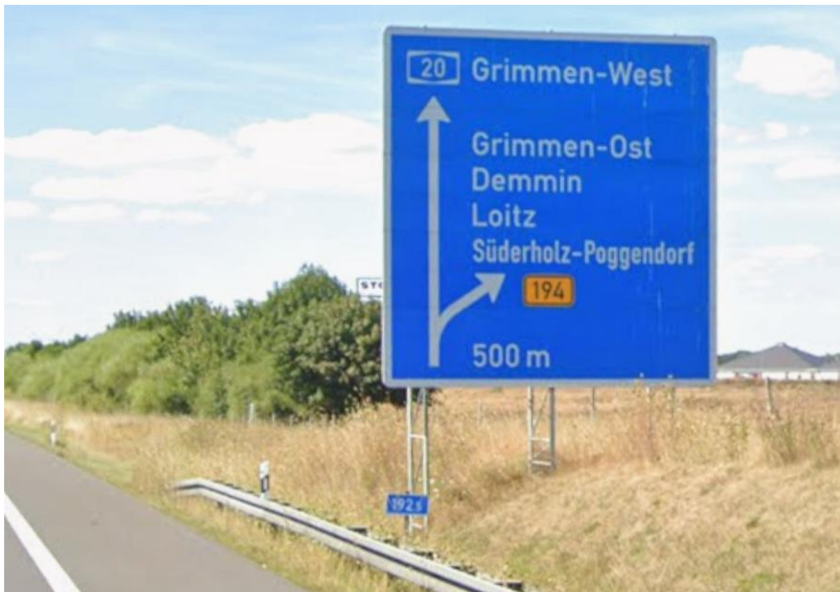
A20 Richtung AS Grimmen-Ost aus östlicher Richtung