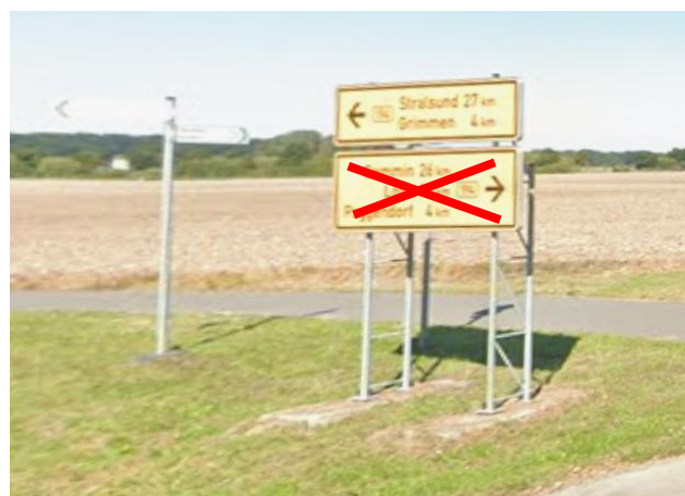
Anlage A 32