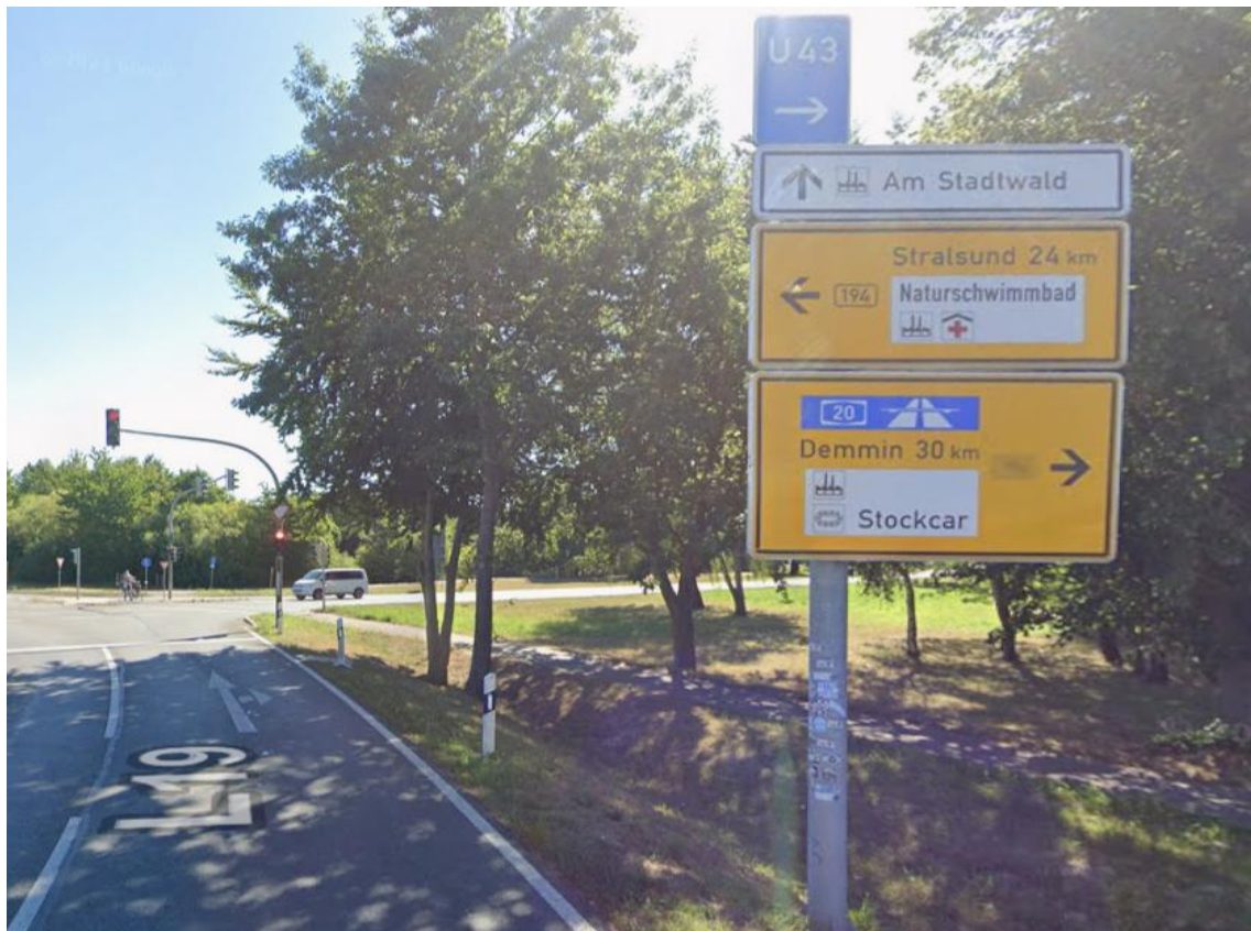
Kreuzung Greifswalder Chaussee / B 194 / Zum Rauhen Berg