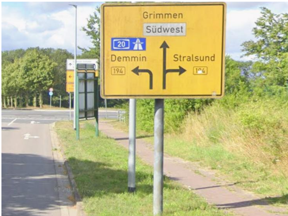
Zum Rauhen Berg Richtung Kreuzung B 194 / Südliche Randstraße