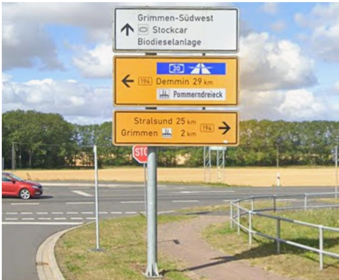
Kreuzung Zum Rauhen Berg / B 194 / Südliche Randstraße