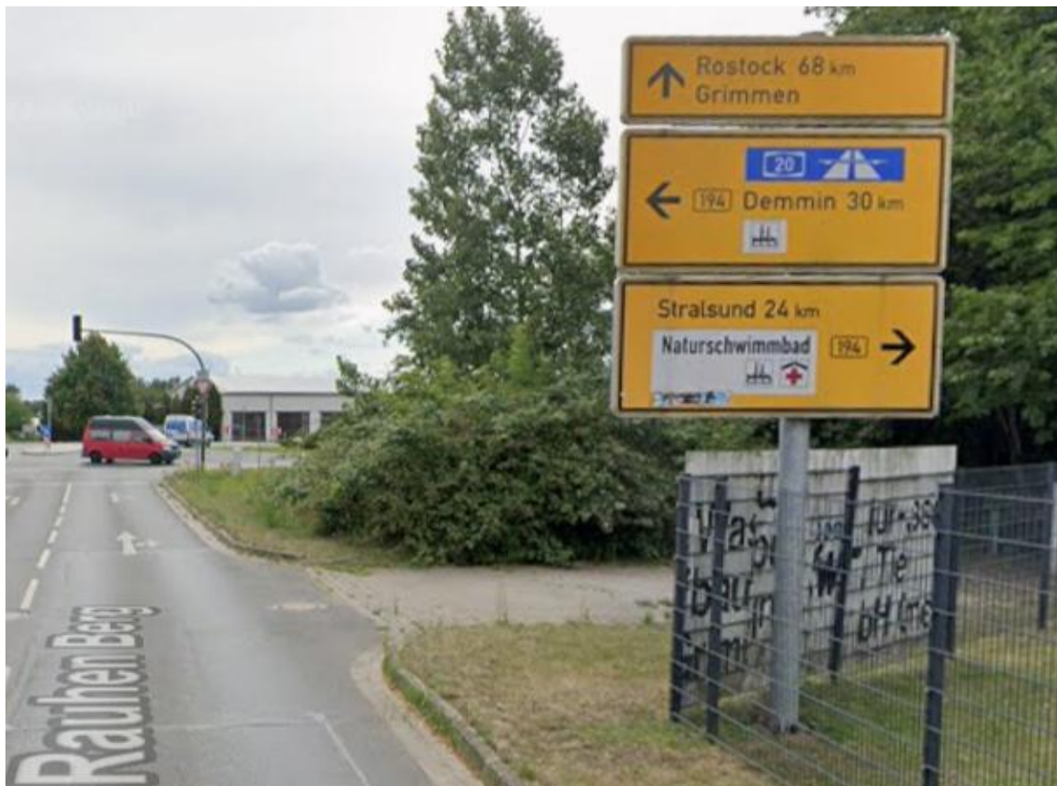
Zum Rauhen Berg Richtung Kreuzung B 194 / Greifswalder Chaussee