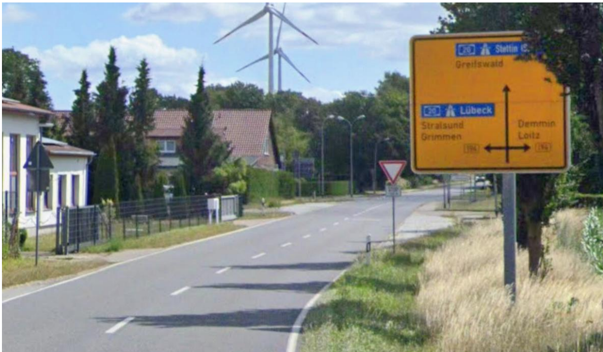
L26 aus Richtung Rakow kommend in Richtung Kreuzung Poggendorf