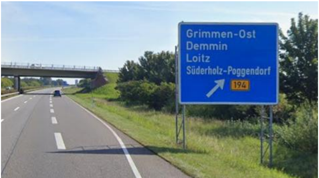
A20 AS Grimmen-Ost Ausfahrt aus westlicher Richtung