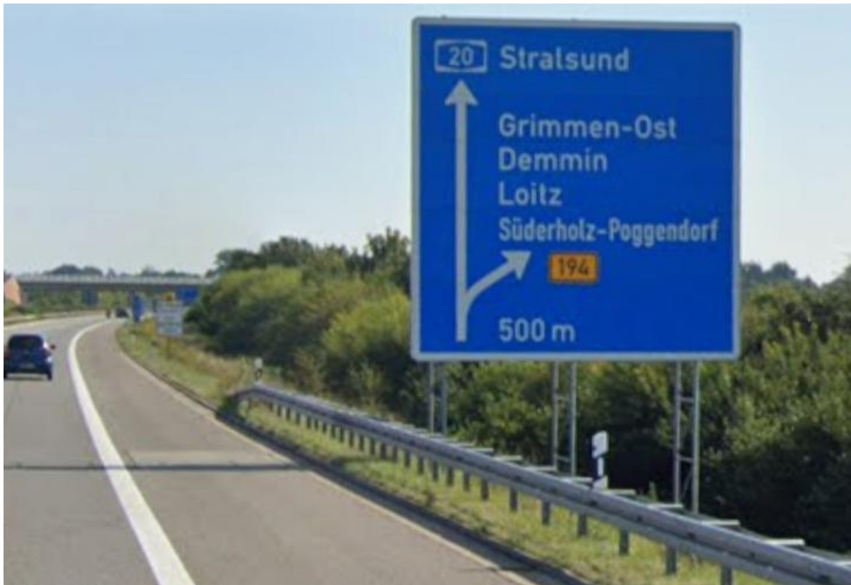
A20 Richtung AS Grimmen-Ost aus westlicher Richtung