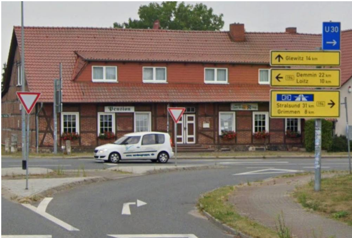
Kreuzung L 26 / B 194 - Abzweig zur B 194 Richtung Grimmen