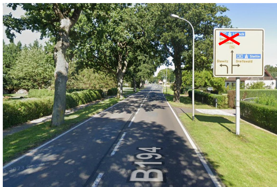
Anlage A 1