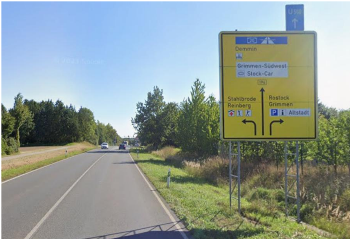
B 194, aus Richtung Norden in Richtung Kreuzung B 194 / Kaschower Damm (L 30)