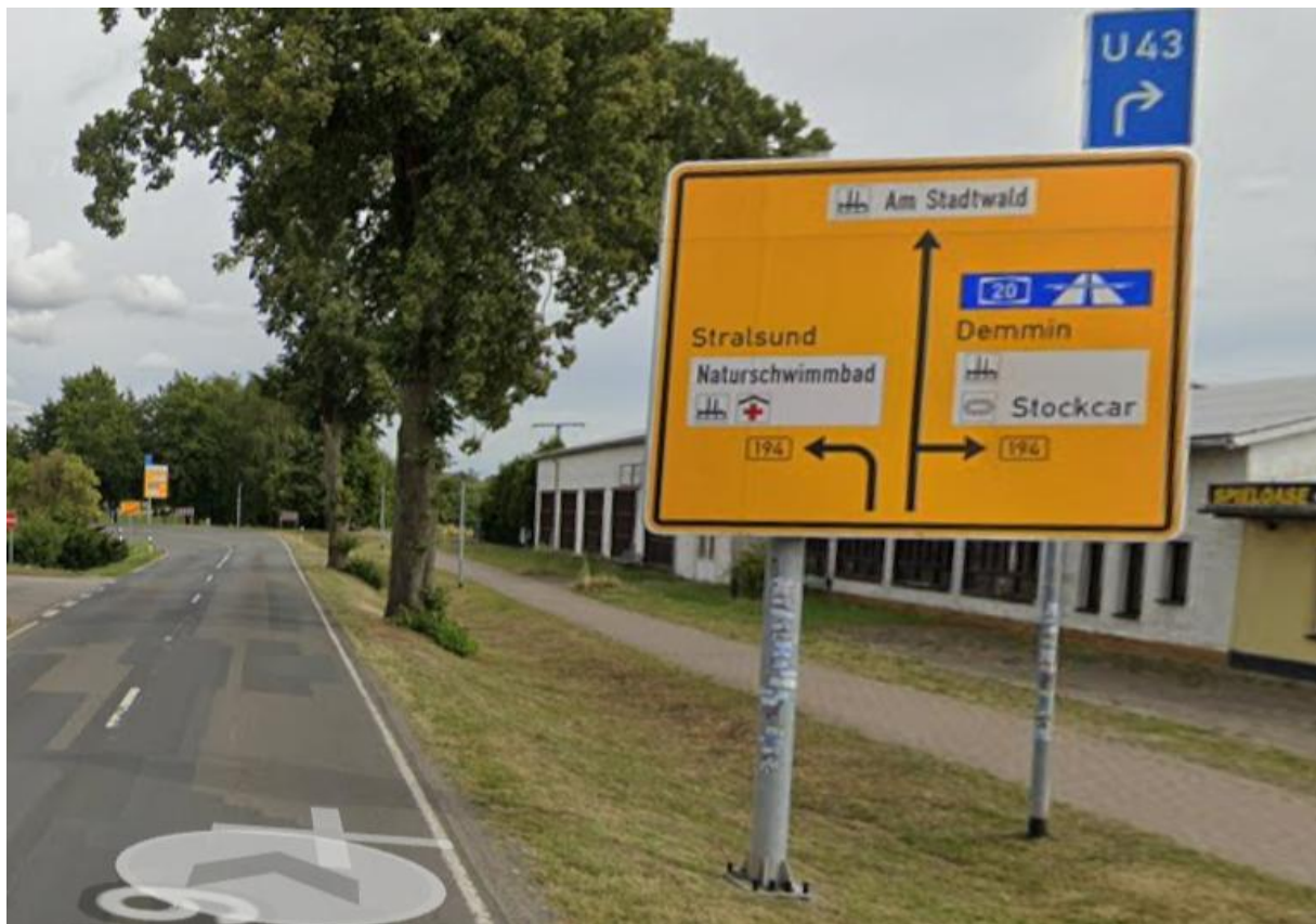
Greifswalder Chaussee von Grimmen zur Kreuzung B 194 / Zum Rauhen Berg