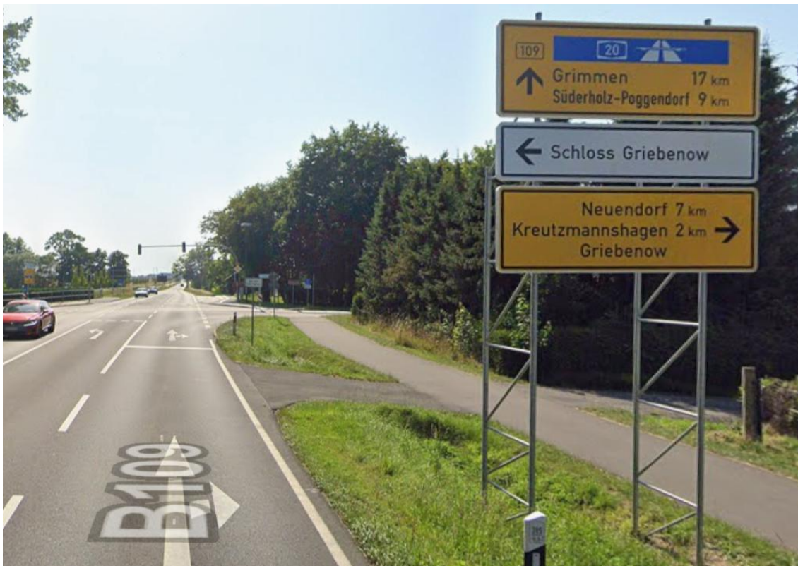
Griebenow, Kreuzung B 109 / NVP 20 / Parkstraße / Gölkweg