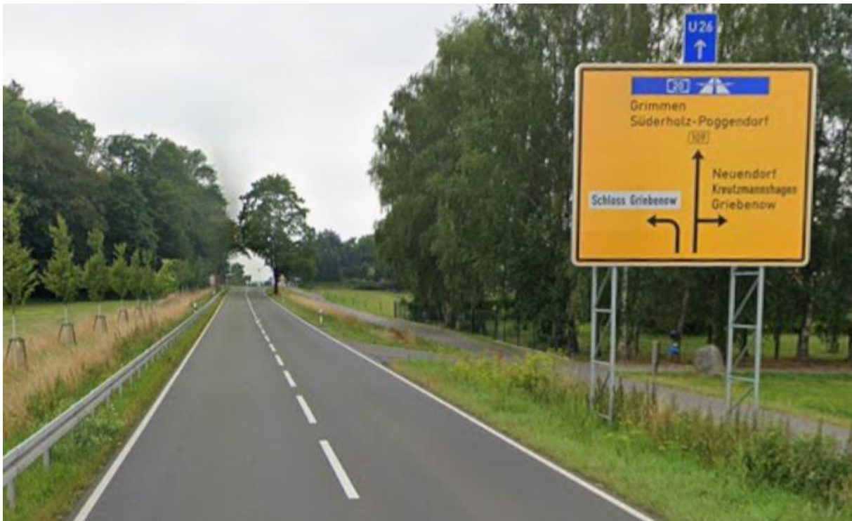
B 109, von Greifswald kommend in Richtung Griebenow