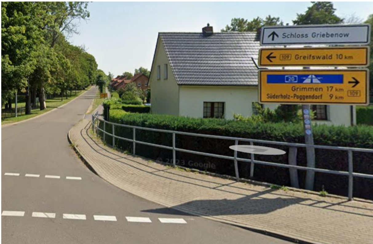
B 109 Abzweig zum Schloss Griebenow