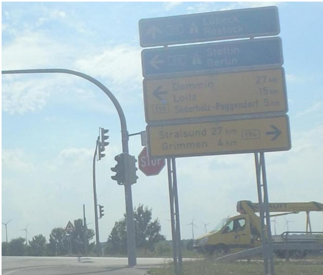
Kreuzung B 194 / Pommerndreieck aus Richtung Gewerbegebiet