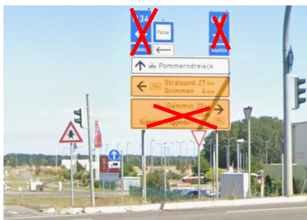
Anlage A 29