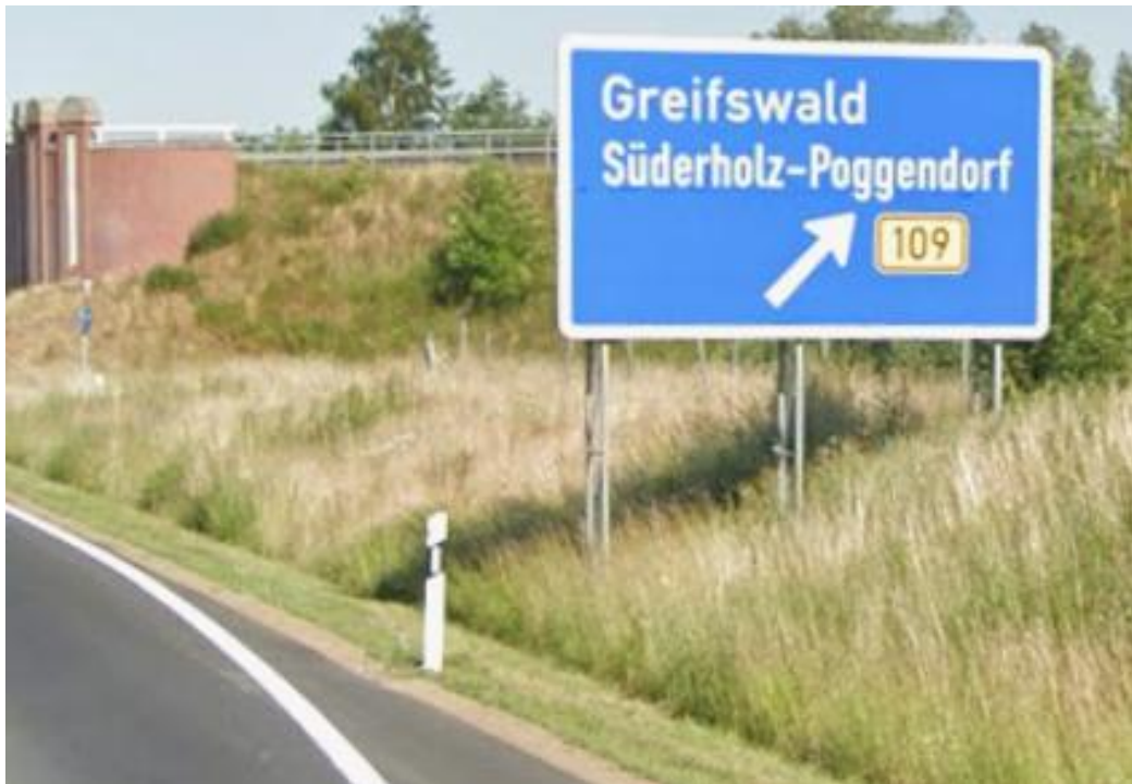
Ausfahrt AS Greifswald von der A20 zur B 109