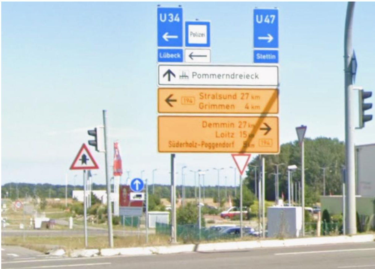
Kreuzung B 194 / Pommerndreieck aus Richtung Ausfahrt A 20