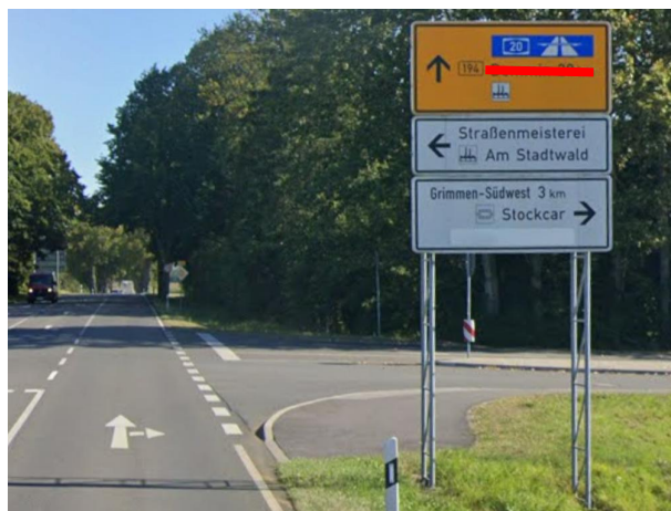
Anlage A 20