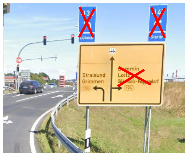
Anlage A 28