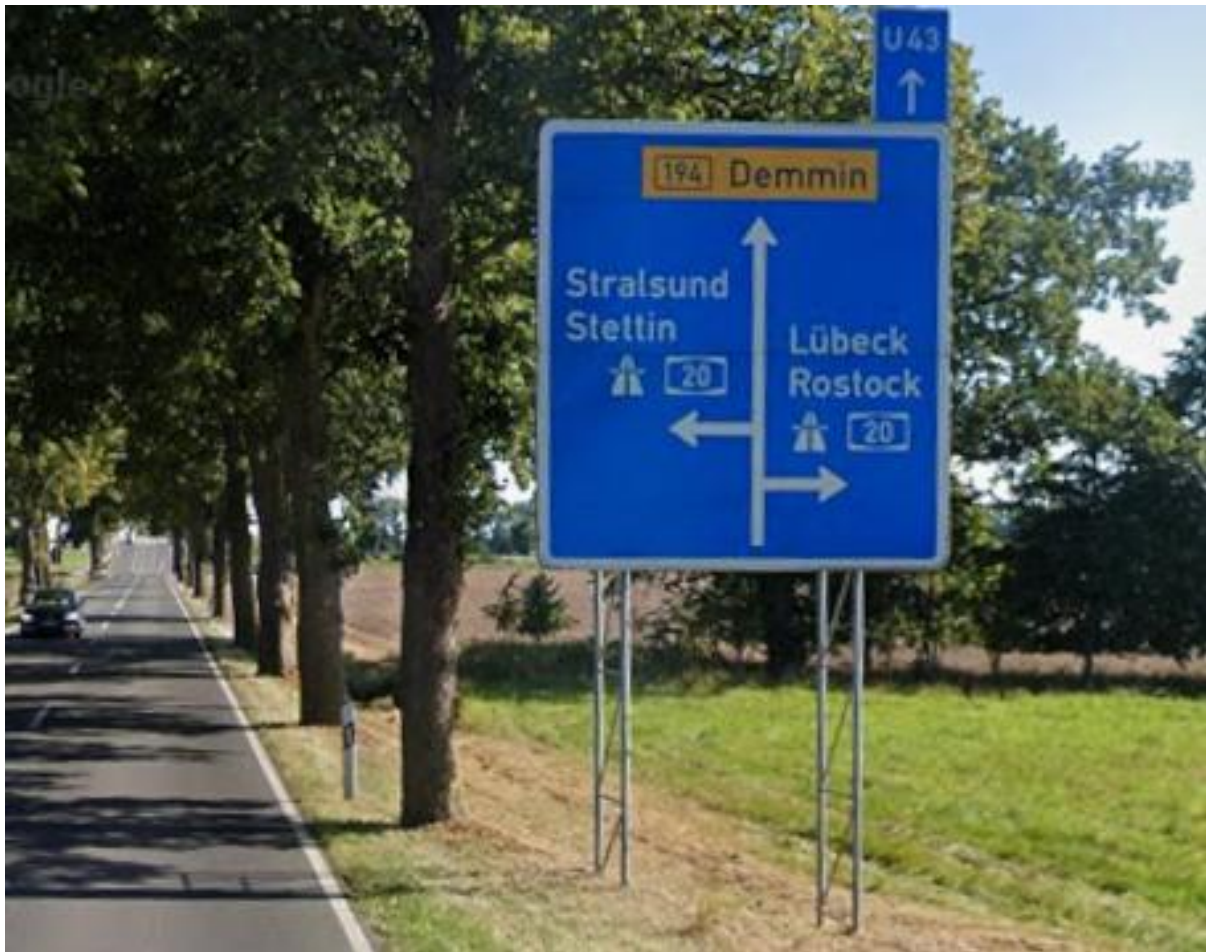
B 194 Richtung A20 AS Grimmen-Ost