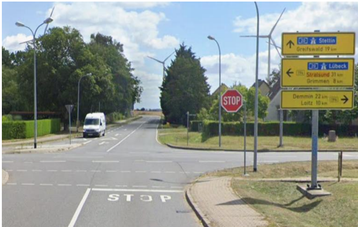
Kreuzung B 194 / L26 aus Richtung Rakow kommend