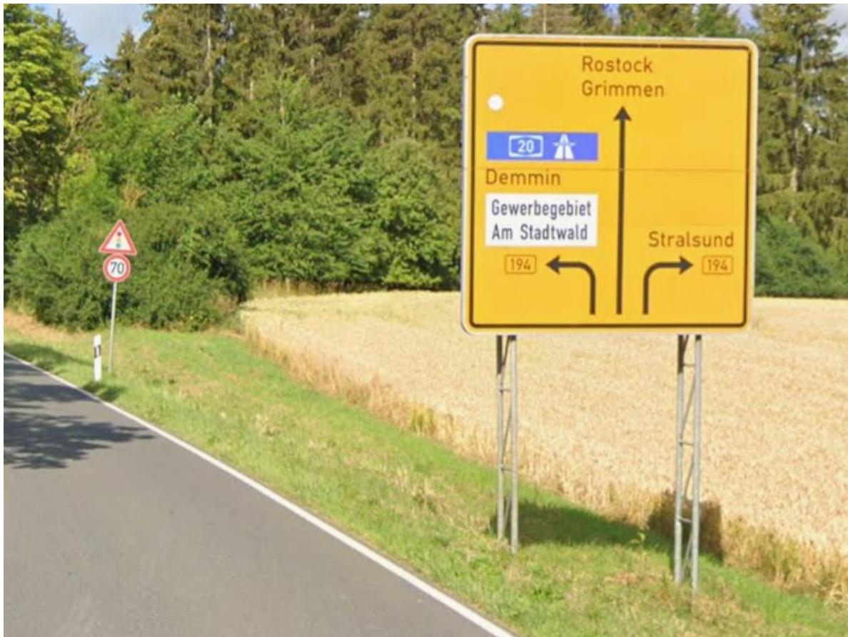
Kaschower Damm (L 30), in Richtung Kreuzung B 194 / Kaschower Damm (L30)