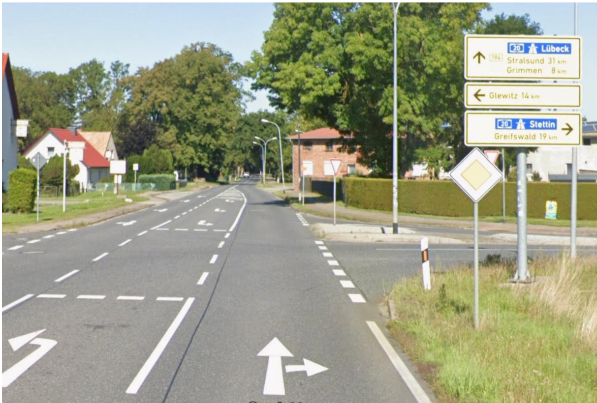
Kreuzung B194 / L26 in Poggendorf