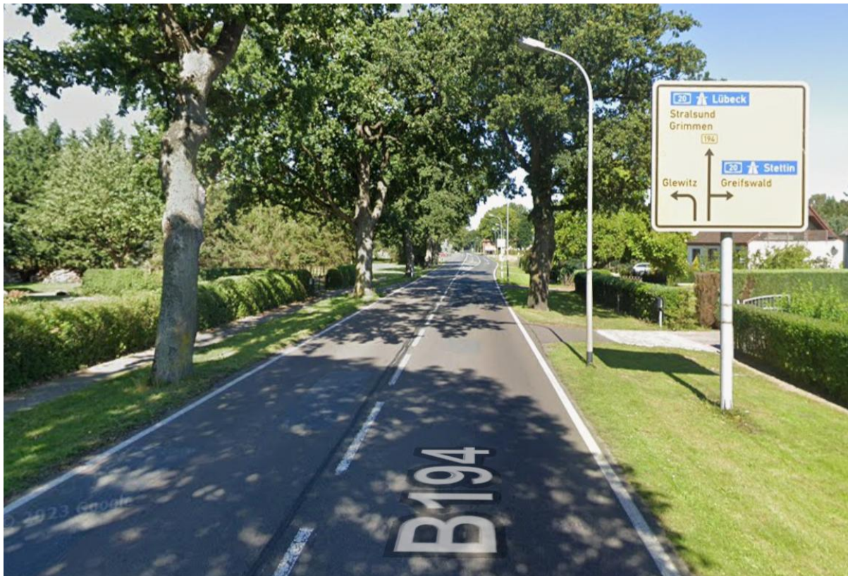
B194 aus Richtung Loitz kommend in Richtung Kreuzung Poggendorf