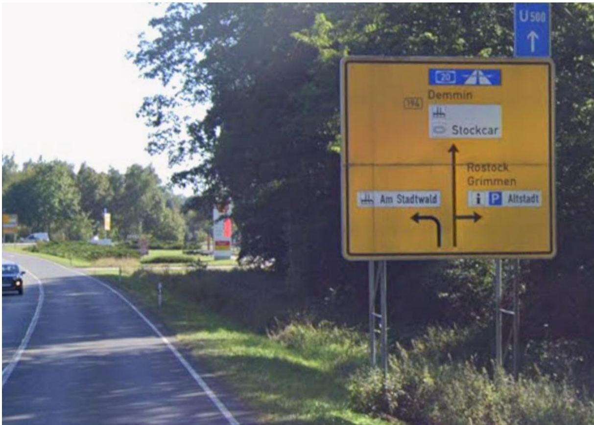
B 194, in Richtung Kreuzung B 194 / Greifswalder Chaussee / Zum Rauhen Berg