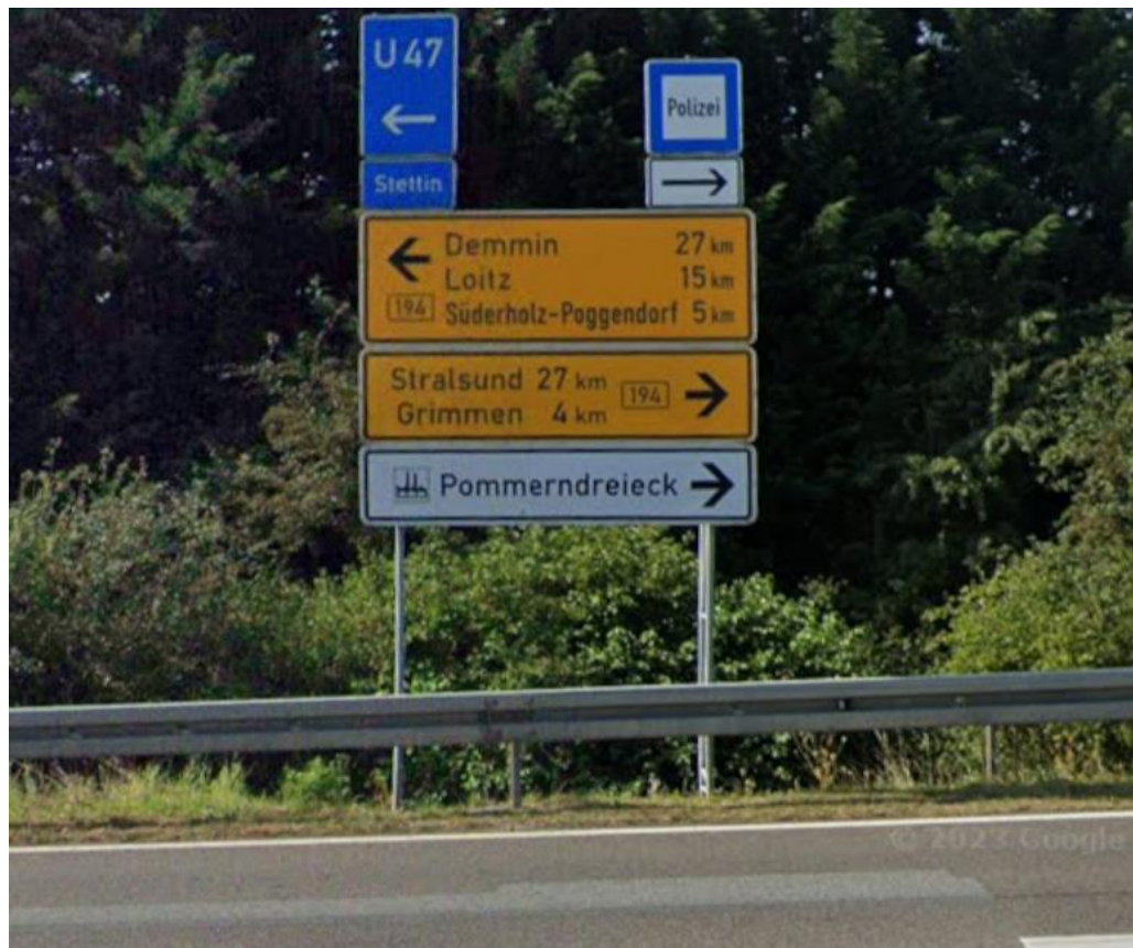
Einmündung Ausfahrt A 20 südöstlich der Autobahnbrücke zur B194