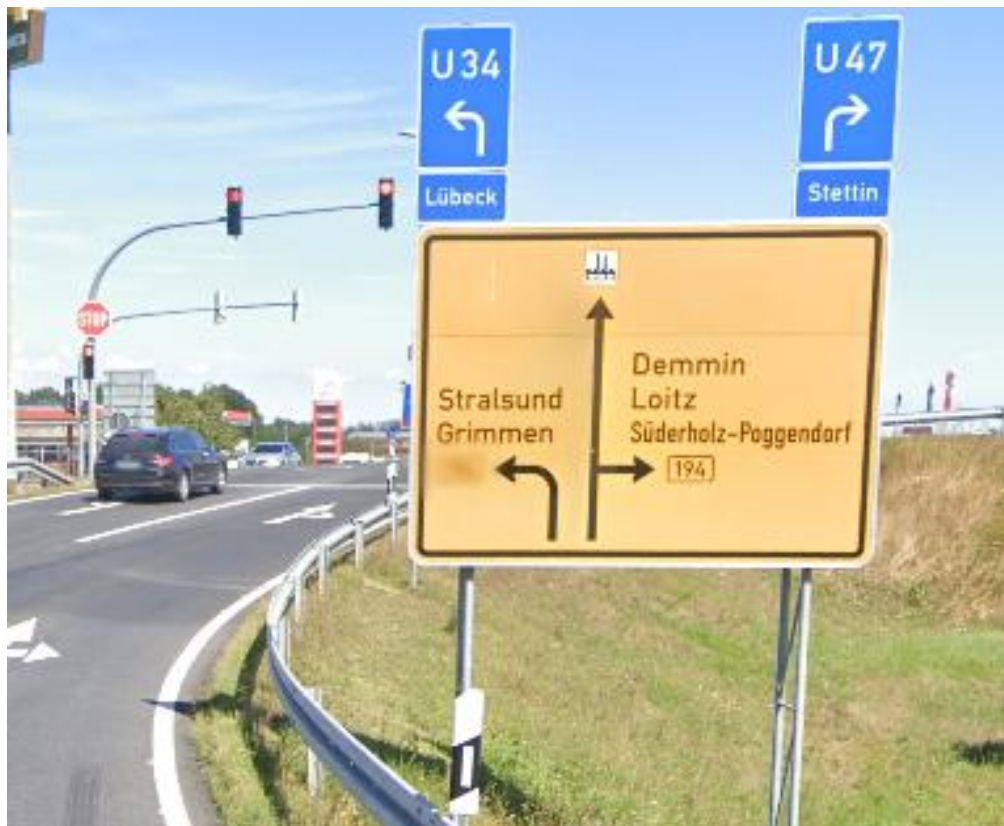
Ausfahrt von der A 20 zur Kreuzung B 194 / Pommerndreieck