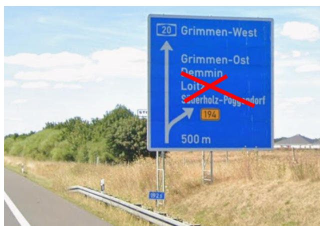
Anlage A 27